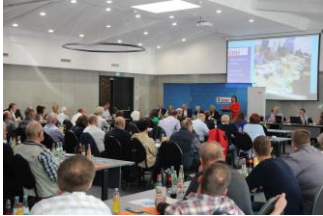
Bild 1