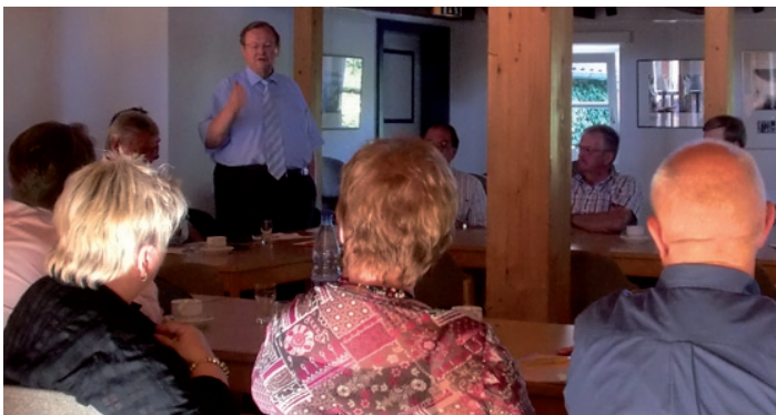
Kreisvorstand und Vorsitzende in Klausur.

(rj) Im Januar und Februar 2011 werden verschiedene Funktionsträgerkonferenzen mit den Vorsitzenden, Schatzmeistern und Presse-